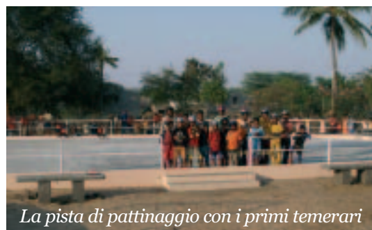
La pista di pattinaggio con i primi temerari