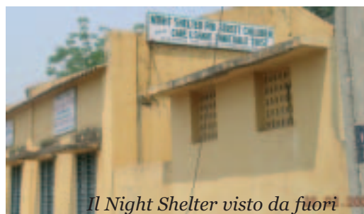
Il Night Shelter visto da fuori