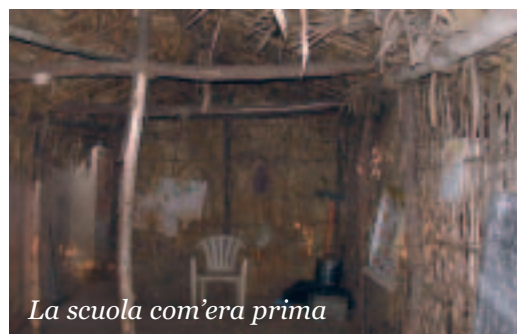
La scuola com'era prima