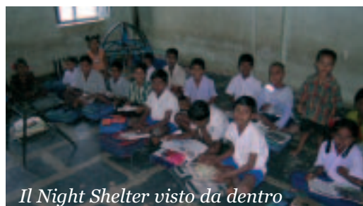
Il Night Shelter visto da dentro

Questo rifugio li protegge dagli abusi e dai pericoli sulle strade di notte. Adesso dobbiamo ristrutturare il rifugio che e' fatiscente. Anche la scuola ne beneficerà: con le migliorie, più ragazzi saranno invitati a venire a scuola.