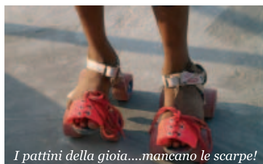
I pattini della gioia....mancano le scarpe!

Lo sport è importantissimo per i ragazzi del nostro villaggio di Daddy's Home. Quasi tutti loro sono ragazzi che vengono dalle strade dell'Andhra Pradesh. Bambini e bambine che non hanno conosciuto le gioie e la spensieratezza dell'infanzia. Alcuni fin dalla piccolissima età si sono trovati a dover lavorare o mendicare per ottenere una scodella di riso.