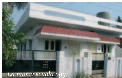
La nuova scuola oggi